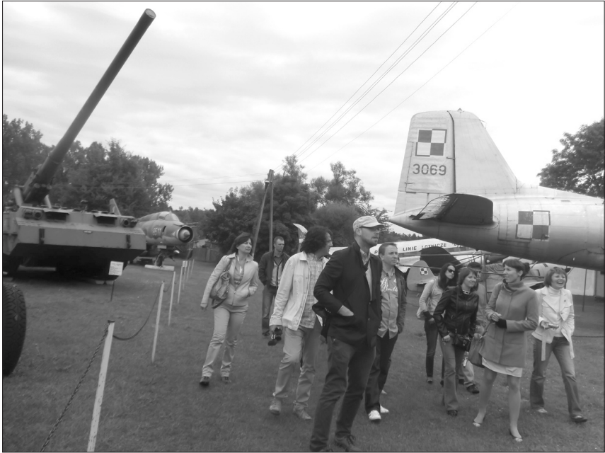
Uczestnicy konferencji Difficult History... podczas zwiedzania Lubuskiego Muzeum Wojskowego w Drzonowie (10 września 2013 r.).