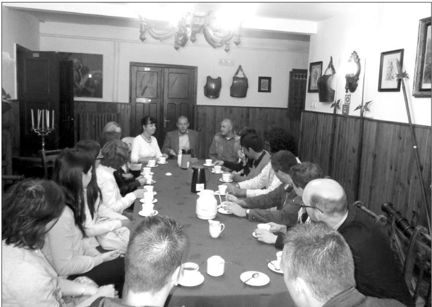
Uczestnicy konferencji Difficult History... na spotkaniu z dyrektorem Lubuskiego Muzeum Wojskowego w Drzonowie (10 września 2013 r.).