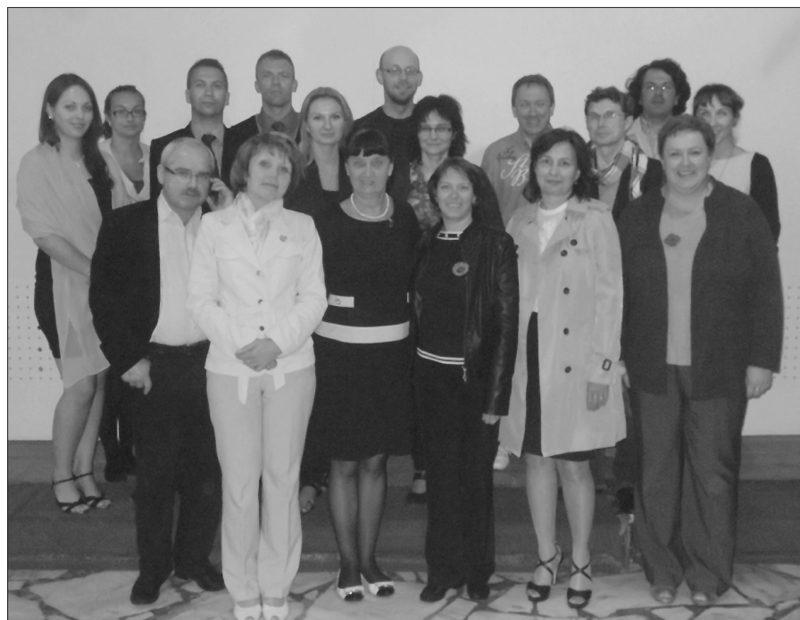
Zespół projektu Difficult History and its European Dimension in Education . Fotografia pamiątkowa na zakończenie obrad w Palmiarni (10 września 2013 r.).