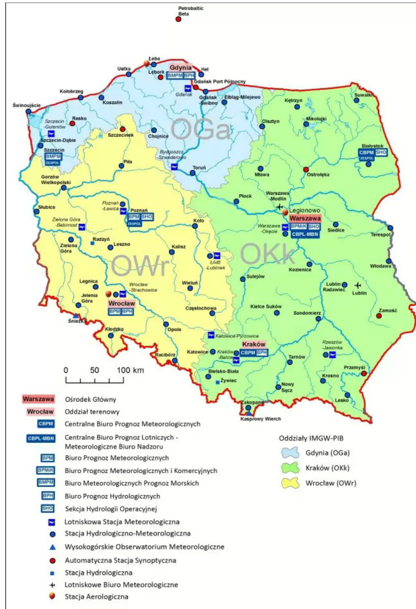
Rys. 2. Mapa zasięgu oddziałów [www.imgw.pl] Fig. 2. Map of the polish branches [www.imgw.pl]