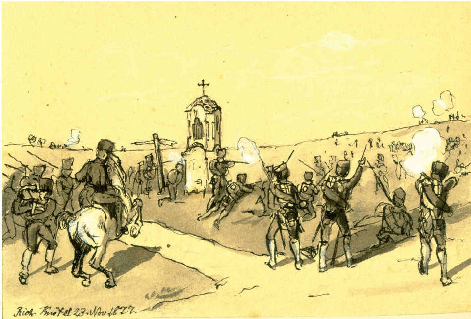
Rycina 5. Potyczka pod głogowską twierdzą z 25 września 1813 roku (okolice Jaczowa). R. Knötel