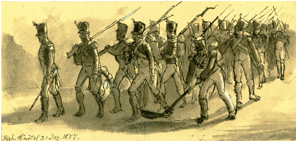
Rycina 6. Wymarsz żołnierzy napoleońskich z twierdzy 17 kwietnia 1814 roku. R. Knötel