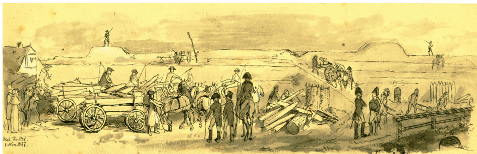
Rycina 1. Umacnianie głogowskich fortyfikacji. Koniec października 1806 roku. R. Knötel