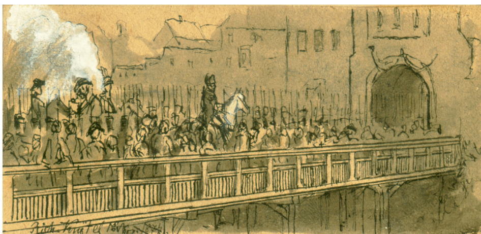
Rycina 2. Uroczysty wjazd Napoleona do Głogowa (Bramą Odrzańską). 16 lipca 1807 roku. R. Knötel