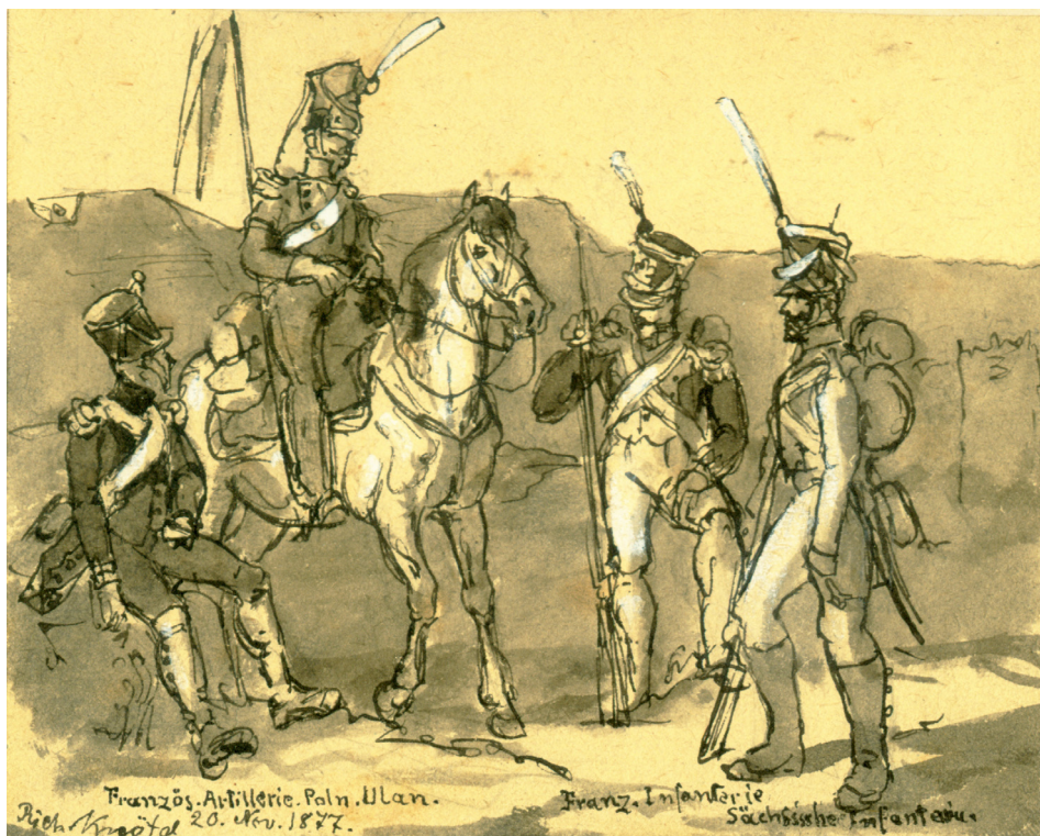
Rycina 3. Przedstawiciele różnych formacji wojskowych Wielkiej Armii, które tworzyły w 1812 roku głogowski garnizon. Od lewej: francuski artylerzysta, polski ułan oraz francuski i saski piechur. R. Knötel