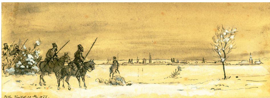
Rycina 4. Pojawienie się pierwszych Kozaków w pobliżu Starych Serbów. 19 lutego 1813 roku. R. Knötel